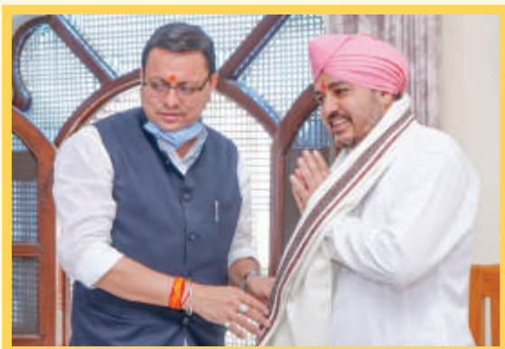
With Shri Pushkar Singh Dhami, CM of Uttarakhand