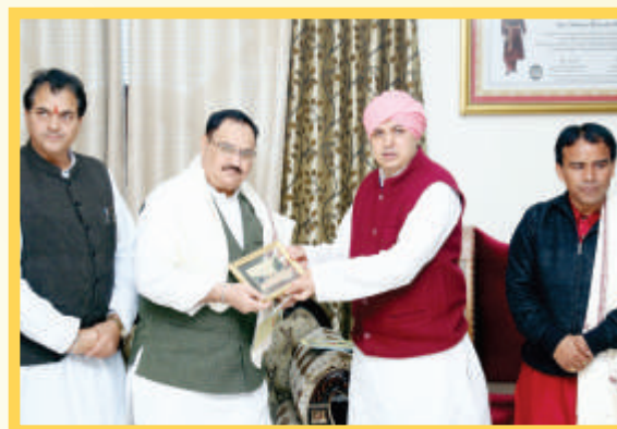
With Shri J.P. Nadda, President, BJP