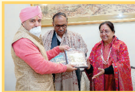
With Smt. Baby Rani Maurya, Hon. Governor of Uttarakhand