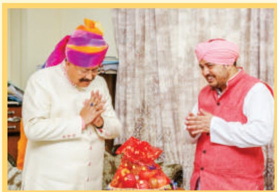
With Shri Satpal Maharaj, Minister of Uttarakhand