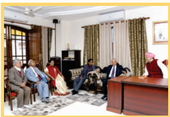
With NAAC Peer Team