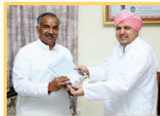
With Shri Arvind Pandey, Minister of Uttarakhand