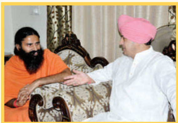
With Yog Guru Baba Ramdev