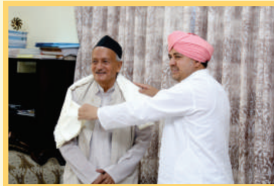
With Shri Bhagat Singh Koshyari, Hon. Governor of Maharashtra