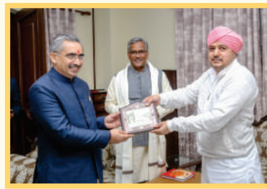
With Shri Sunil Uniyal Gama, Mayor, Nagar Nigam, Dehradun