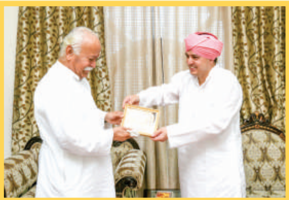
With Shri Mohan Bhagwat, Chief RSS