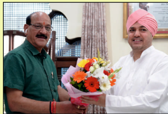
With Shri Subodh Uniyal, Minister of Uttarakhand