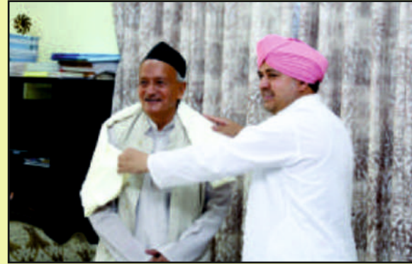
With Shri Bhagat Singh Koshyari, Hon. Governor of Maharashtra