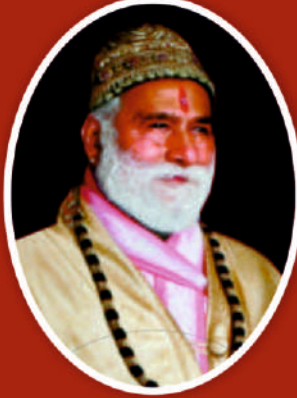
ब्रह्मचरीन श्री महन्त इन्दिरेशचरणदास जी महाराज संस्थापक (14 नवम्बर 1919-10 जून 2000)