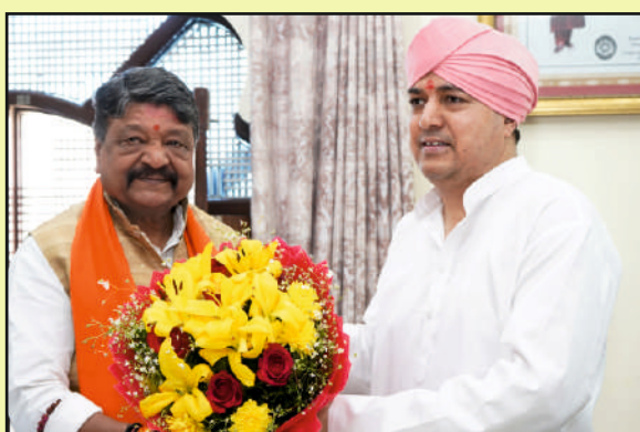
With Shri Kailash Vijayvargiye, General Secretary., (BJP)