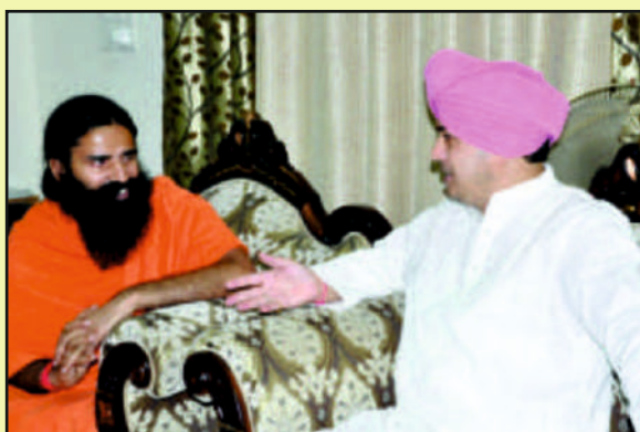
With Yog Guru Baba Ramdev