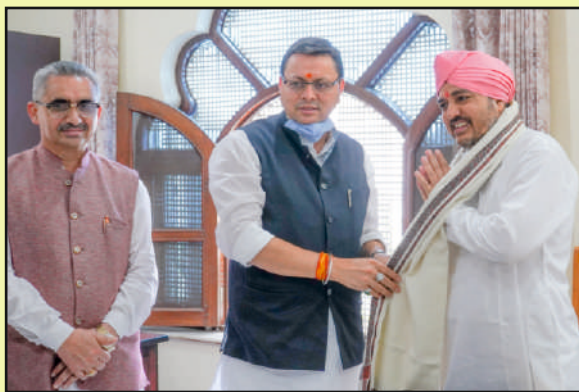
With Shri Pushkar Singh Dhami, CM of Uttarakhand