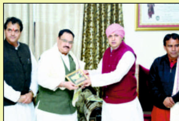
With Shri J.P. Nadda, President, BJP