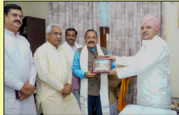
With Shri Jitendra Singh, Central Minister