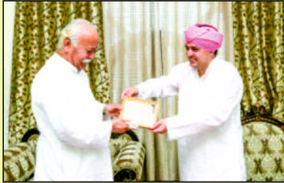
With Shri Mohan Bhagwat, Chief RSS