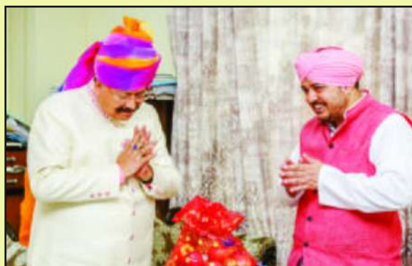
With Shri Satpal Maharaj, Minister of Uttarakhand